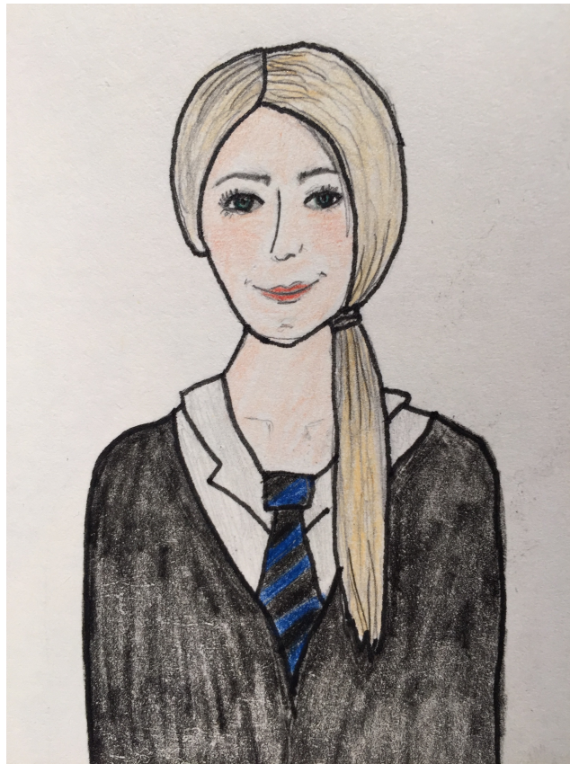
(Zeichnung von Hermine Malfoy von Jennifer)

Quill: Hallo Hermine, nun bin ich seit etwa einem halben Jahr hier und habe schon die Redaktion des Tagespropheten übernommen. Und genau in diesem habe ich eine Umfrage gestartet, welchen Lehrer mein Team interviewen soll. Ich denke, es ist sicher sehr interessant die Reihe „Schüler fragen Lehrer“ zu starten und auch die Schüler entscheiden zu lassen, wer interviewwürdig ist. Die Mehrzahl der Schülerschaft hat sich für dich entschieden, also bist du mein erstes Opfer! ? Für dich und die Leserschaft nur die kurze Information: Diese Reihe soll den Schülern die Lehrer näher bringen und den anderen Lehrern Motivation geben, sich auch befragen zu lassen! Dann beginnen wir mal mit dem Interview, danke übrigens, dass du dich dazu bereit erklärt hast!